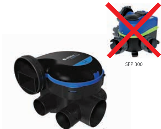
EasyHOME® HYGRO Premium MW SP